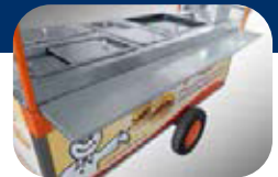
REPISA DE SERVICIO

Gabinete con cubierta de Acero Inoxidable